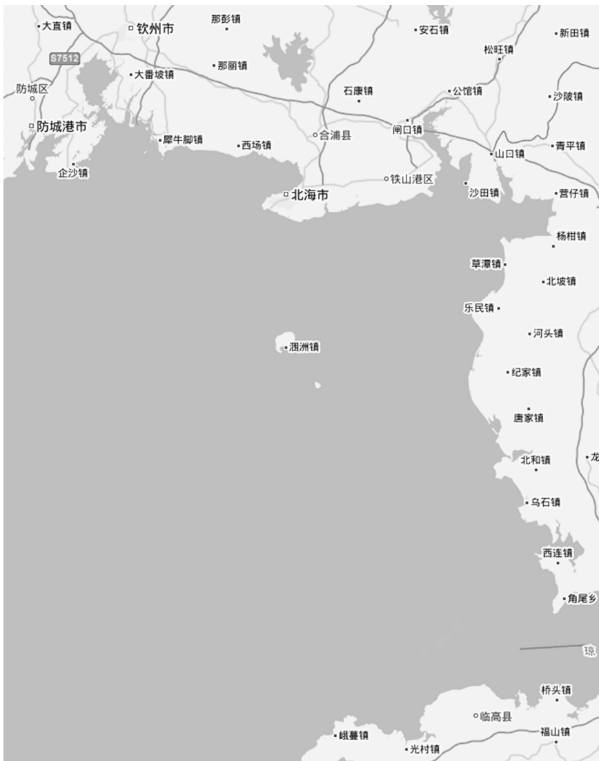
图3 本文所涉北部湾地区示意图